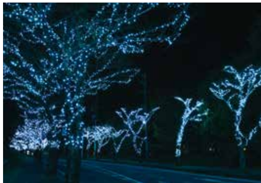
◀国道306号を彩るイルミネーション

11月 2月23日まで17:00～22:00に点灯 30日 ウィンターイルミネーション