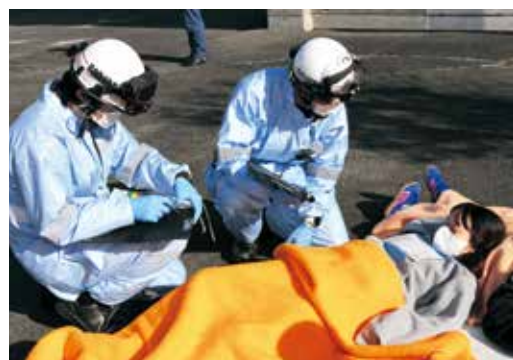
◀傷病者役からけがの状態を聞き取る救急隊員

— 度に多数の傷病者が発生する集団救急事故に適切に対応するための訓練が消防本部で実施され、菰野厚生病院の医師や看護師、聖十字看護専門学校の学生、応急手当普及員の会の会員、消防団員、消防署職員など約80名が参加しました。建物の天井が崩落し、多数の傷病者が発生したという想定で行われた訓練では、駆け付けた救急隊員が負傷の程度を確認し、搬送の優先順位を決定する「トリアージ」を実施しました。その後、病院と想定された仮設テントへ、トリアージの結果に基づいて順に救急車で搬送し、一連の対応の流れを確認しました。