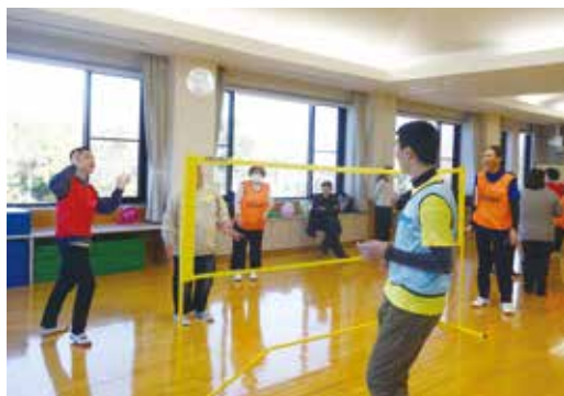
◀スポーツ体験を行う参加者たち

12月 「たのしくからだを動かそう」をテーマに 13日 障がい者スポーツ体験教室