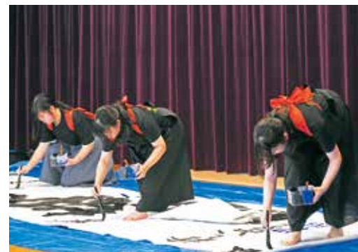
◀書道パフォーマンスを披露した菰野高校書道部の生徒たち

菰 野地区コミュニティセンターで菰野地区ふれあいまつりが開催されました。当日はダンスやピアノの弾き語り、合唱など趣向を凝らしたステージ発表が行われ、園児から大人まで幅広い演目が披露されました。また、絵画や書道、俳句といった芸術作品も展示され、地域の方々の日頃の成果を発表する場となっていました。