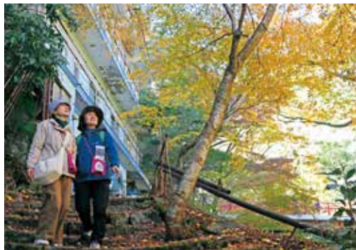
◀紅葉を眺めながら歩く参加者

11月 400人の参加者が秋の湯の山温泉を巡る 29日 ガストロノミーウォーキング