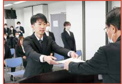
▲4月1日の辞令交付式で辞令を受け取る新規採用職員