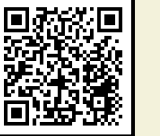
菰野町施設 予約サービス

菰野町B&G海洋センターと菰野西競技場の利用申請がインターネット上で可能になります。予約には利用者情報の登録が必要で予約受付は利用日の1か月前からできます。クレジットカード等があれば、予約時にオンライン決済で使用料を支払うこともできます。