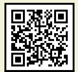
すぐレポ 通報サイト

町内の道路の舗装や側溝の破損箇所などをスマートフォンで撮影し、位置情報などとともに町役場にレポートしていただくことで迅速な対応が可能になるサービスです。