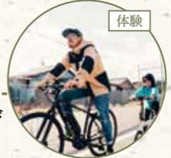
菰ベリティ レンタル3時間ペア利用券 (一社) 菰野町観光協会