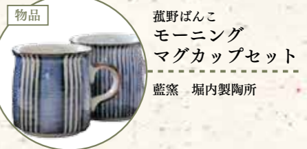
菰野ばんこ モーニングマグカップセット 藍窯 堀内製陶所