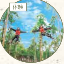
フォレストアドベンチャー・湯の山 1名様利用券 フォレストアドベンチャー・湯の山