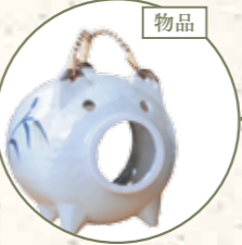
菰野ばんこ 蚊やり豚 (備松尾製陶所)