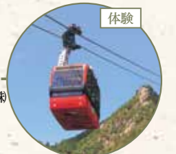
御在所ロープウェイ 満喫セット 御在所ロープウェイ(株)