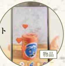
湯の花せんべい AR缶3缶セット 備日の出屋製菓