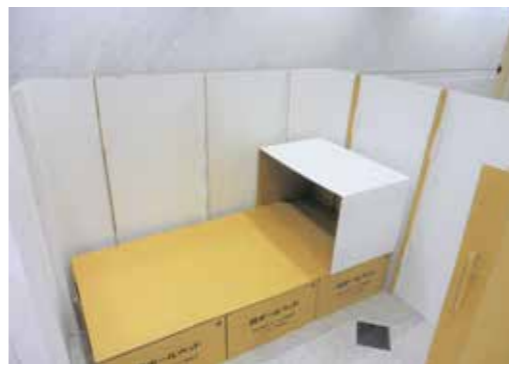
▲納入される予定の段ボールベッドと段ボール間仕切り

セ ツツカートン(株)と町との災害発生時における段ボール製品の調達に関する協定が締結されました。これは、災害発生時に避難所での生活環境向上を図るため、町が要請することでセツツカートン(株)が段ボールベッド、段ボール間仕切り等を作成し、避難所へ搬送するものです。感染拡大防止の観点から、書面による協定締結となりましたが、今後、災害発生時に汎用性の高い段ボール製品の活用が期待されます。