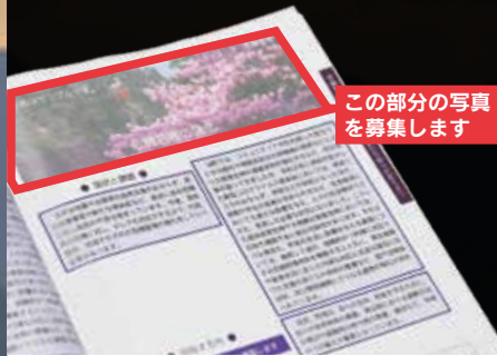
この部分の写真を募集します