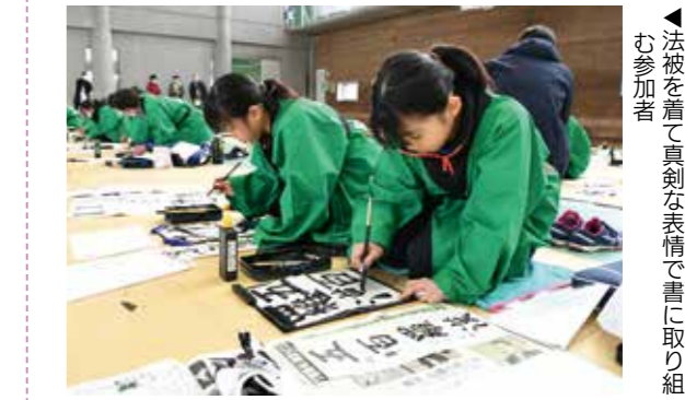
▲法被を着て真剣な表情で書に取り組む参加者

新春書き初め大会を体育センターで開催し、子どもから大人まで69人が参加しました。参加者は「五百羅漢」「菰野富士」といった菰野町にちなんだ課題や、「おとし玉」「もちつき」など新年にちなんだ課題などにそれぞれ取り組んでいました。入賞した作品は1月10日から22日までの期間、役場本庁舎1階のロビーに展示されました。