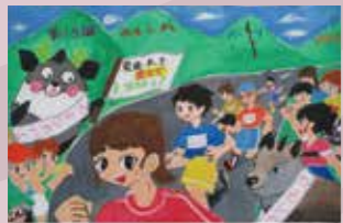
最優秀賞 POSTER CONTEST 堤 萌華 中学生以上の部