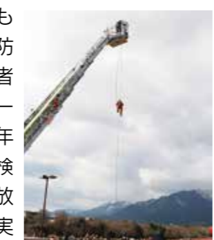
▲ロープ登はん訓練の実演

消防団員と消防職員合わせて129人、車両14台が集い、消防出初式を保健福祉センターけやき駐車場で開催しました。出初式には来場者も多く訪れ、優良消防職団員とその関係者の表彰を行い、ロープ登はん訓練や3年ぶりとなる通常点検や三滝川への一斉放水といった訓練も実施しました。