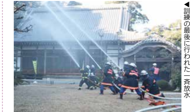
▲訓練の最後に行われた一斉放水

菰野第三区の見性寺で文化財防火運動に伴う特別消防訓練を実施しました。これは町民の文化財に対する防火意識を高めるために実施する訓練で、関係者や消防職員、消防団員ら約40人が参加し、見性寺に遺されている肖像画などの文化財を安全に搬出する訓練や延焼防止のための消火活動訓練のほか、一斉放水も行われました。