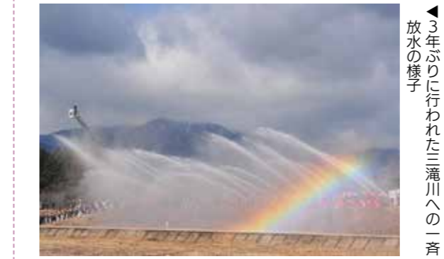
▲3年ぶりに行われた三滝川への一斉放水の様子

消防団員と消防職員合わせて129人、車両14台が集い、消防出初式を保健福祉センターけやき駐車場で開催しました。出初式には来場者も多く訪れ、優良消防職団員とその関係者の表彰を行い、ロープ登はん訓練や3年ぶりとなる通常点検や三滝川への一斉放水といった訓練も実施しました。