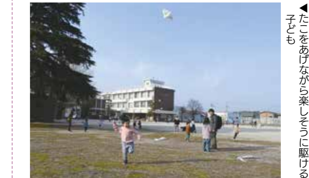
▲たこをあげながら楽しそうに駆け回る子ども

たこあげ大会を朝上小学校グラウンドで開催し、家族連れを含む約80人が参加しました。当日は穏やかな風が吹く晴天で、参加者は思い思いの絵柄を書き込んで作り上げたたこを大空へあげていました。グラウンドには、たくさんのカラフルなたこが連なるように舞いあがっていました。