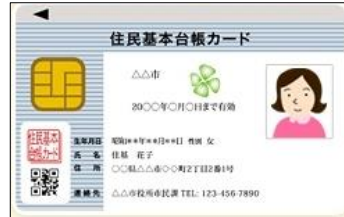
住民基本台帳カード