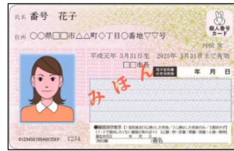
マイナンバーカード