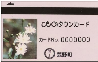
こものタウンカード