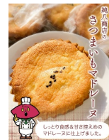
東員町 『さつまいもマドレーヌ』