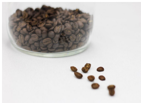
朝日町 『Asahi ブレンドコーヒー豆』