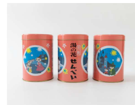
菟野町 『MOOMIN 湯の花せんべい』