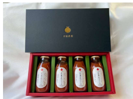
木曽岬町 『MINI とまとジュース』