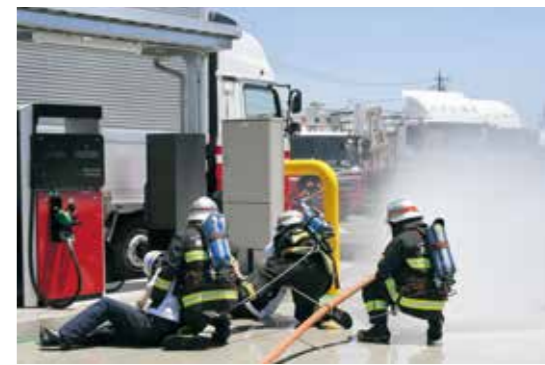
▲ 消防署職員による救助訓練の様子

川北区内のニッコン（株）菰野出張所で特別消防訓練を実施し、事業所、消防署、消防団（鶴川原分団、本部分団）など約50人が参加しました。今回の訓練は、事業所敷地内の給油所で給油中のトラックから出火し、従業員が逃げ遅れたという想定で行われました。訓練では、従業員による119番通報と初期消火が行われた後、到着した消防職員、消防団員による救助活動、一斉放水を行いました。