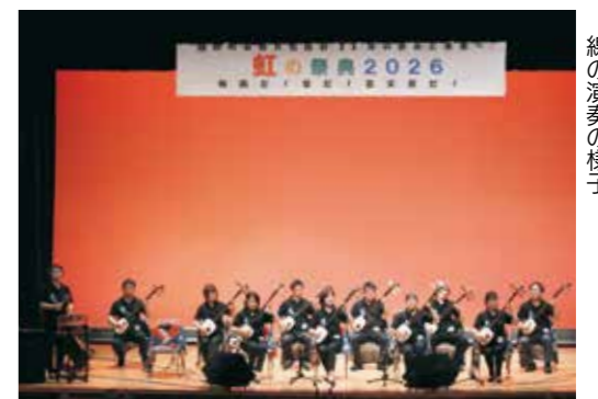
▲ オープニングで披露された津軽三味線の演奏の様子

菰野町芸術文化協会主催の「虹の祭典 2026 梅雨だ！ 宴だ！ 芸文祭だ！」が町民センターで2日間にわたり開催されました。当日は、日本舞踊や社交ダンス、コーラス、詩吟などさまざまな団体や個人が舞台発表を行い、来場者を楽しませました。