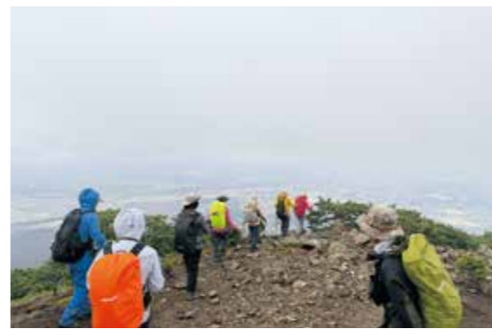
▲ 山頂からの景色を眺める参加者たち

いなべ市と菰野町にまたがる鈴鹿セブンマウンテンの一つである竜ヶ岳で、両市町が連携した案内付き登山ツアー「THE HIKE 鈴鹿セブンマウンテンズ in 竜ヶ岳」を開催しました。登山初心者でも安全に楽しめるよう、当日は多くの登山経験者がサポートし、約20名の参加者は山の歴史などの解説を聞きながら雄大な自然を満喫しました。