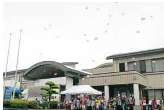
▲ フィナーレの風船流しの様子

けやきフェスタ 2026 が、保健福祉センターけやきで開催されました。会場では、福祉体験コーナーや保健コーナーなど趣向を凝らしたブースが多数出展され、来場者は手話体験や要約筆記体験、車いす体験などを通して福祉や障がいに対する理解を深めました。