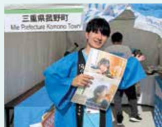
▲大阪・関西万博に出展し、菰野町をPRしました。