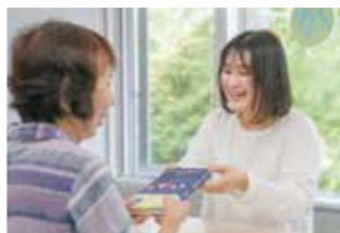
▲講演後には参加者との交流も行われた。