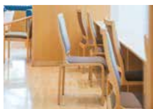
▲「毎日のように通った思い出の場所。今も帰省すると子どもと訪れます。」

講演会後のインタビューで、お気に入りの場所を尋ねると、迷わず挙げたのが「菺野大橋」でした。「橋を渡るときに見える御在所岳が本当に好きでした。天気の良い日は鈴鹿山脈がきれいに見えて、自転車に乗りながらよく眺めていました」。紅葉の季節には、写真を撮ることもあったそうです。離れた今でも、その景色は心に残り続けています。 さらに思い出深い場所として挙げたのが菺野町図書館です。テラスで友人とテスト勉強をしたこと、自販機で飲み物を買って語り合ったこと、今でも帰省すると子どもを連れて訪れること……。作家としての原点は、身近な風景や場所の中にありました。