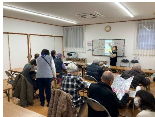
菟野第三区民栄会館