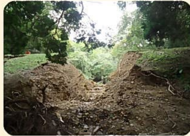
平成25年9月、台風18号による大雨により決壊したため池

ため池は全国におよそ21万箇所あり、古くから農業用水の貯水池として利用されてきましたが、その多くは築造から100年以上が経過し、老朽化が進行しています。さらに、近年多発している局地的な大雨や地震などの自然災害が重なることにより、ため池が決壊し、人命や財産などに大きな被害をもたらす危険性が高まります。