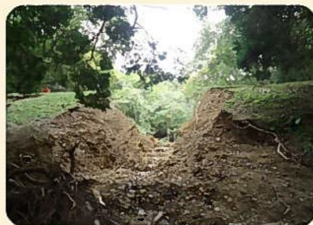
平成25年9月、台風18号による大雨により決壊したため池

ため池は全国におよそ21万箇所あり、古くから農業用水の貯水池として利用されてきましたが、その多くは築造から100年以上が経過し、老朽化が進行しています。さらに、近年多発している局地的な大雨や地震などの自然災害が重なることにより、ため池が決壊し、人命や財産などに大きな被害をもたらす危険性が高まります。