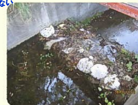
土のうによる洪水吐のかさ上げ

洪水吐に堆積した土砂やゴミ等は、流水断面を阻害し、適切な機能を発揮することができません。また、ため池の貯水を増やすために、洪水吐に土のうを積む様子がよく見られますが、これも危険ですので止めてください。