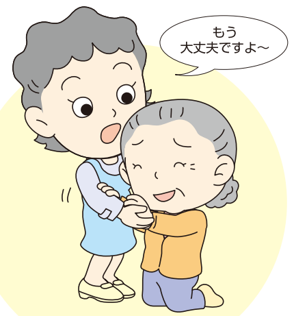
隣近所の安否確認