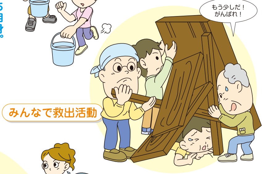
みんなで救出活動