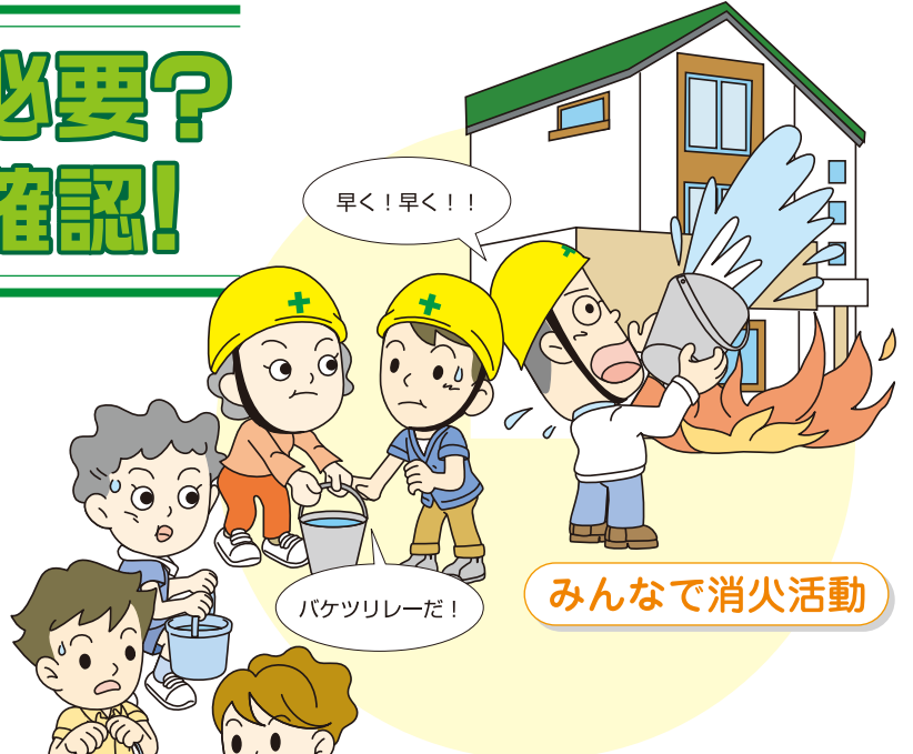
みんなで消火活動

自主防災の主人公は私たち自身。 でも、個人や家族だけでは大きな災害に立ち向かえないとき、 必要となるのが「自主防災組織」です。 「自らの地域は皆で守る」 隣近所の人々が協力し合い、救助活動、初期消火や避難所の 運営などを行っていくのが自主防災組織です。 そしてもちろん